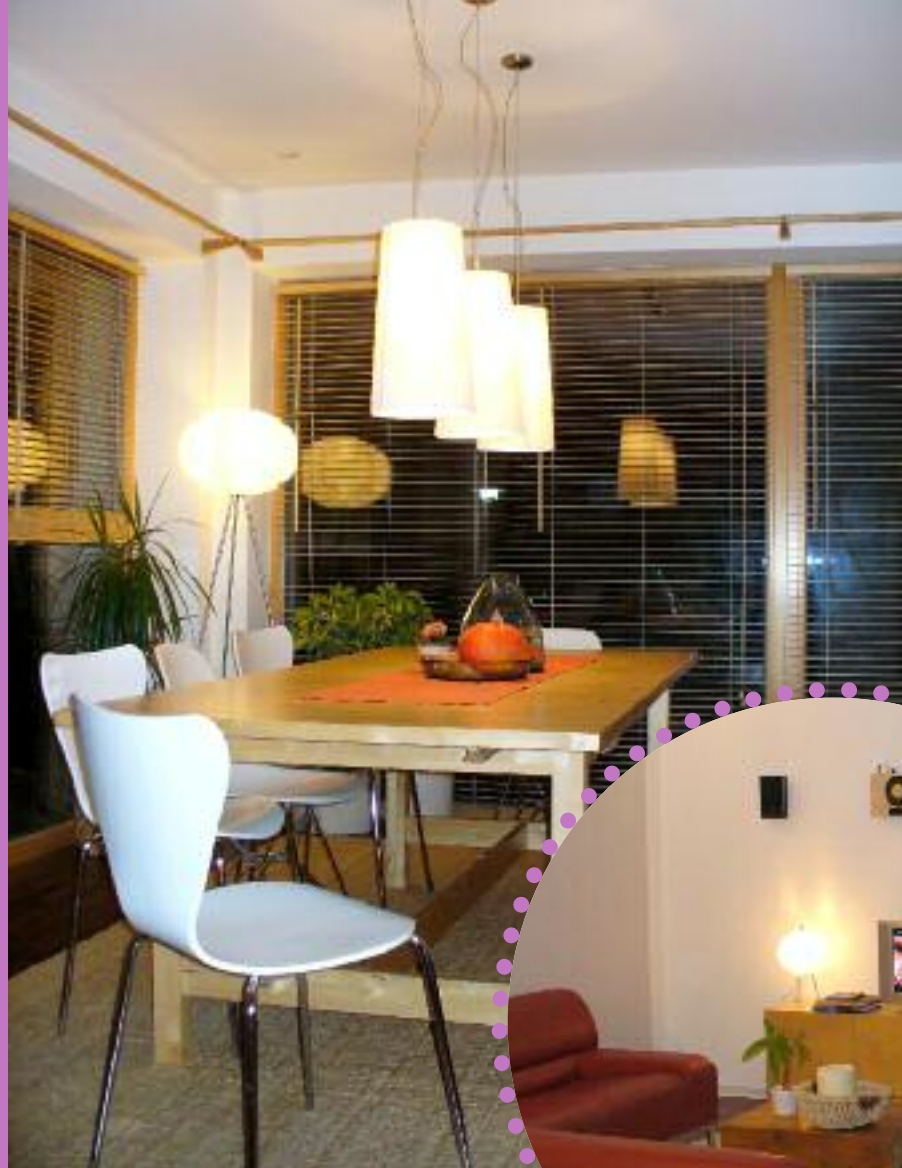
▲ Gesellige Insel Das schlichte Weiß zeigt sich in der Möblierung und setzt sich in den Leuchten sowie an Decke und Wänden fort. Die Stehleuchte sorgt vor den Fensterflächen für Stimmungslicht