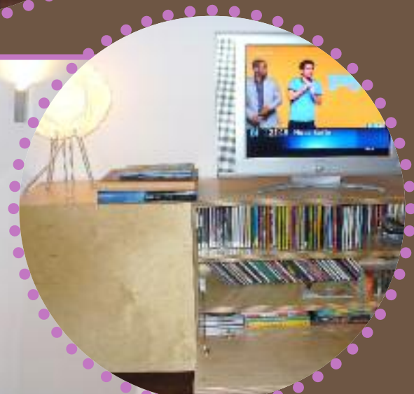
◀ ▲ Feine Details Viel Stauraum war in diesem Raum nicht nötig, nur die CDs kamen im Hi-Fi-Möbel unter. Um den Wohnbereich farblich zu betonen, wurde eine Wand in Hellgrau gestrichen

Text: Andrea Mende; Fotos: Raumkonzept7.de