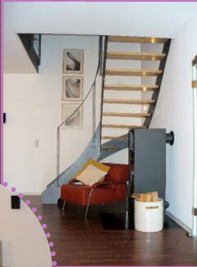
◀ ▲ Highlights Unter der offenen Stahl-Holzteresse befindet sich jetzt ein Kaminofen, flankiert von einem bequemen Sessel, passend zum Ledersofa. Hi-Fi-Anlage und TV stehen den Sofas gegenüber: Kriegers haben sich aufs Wesentliche beschränkt